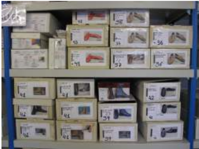
Área de vestuario del Teatro