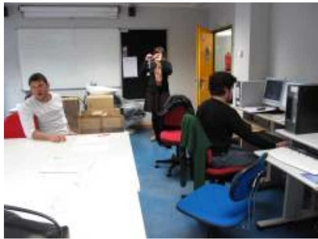
Aula de Producción