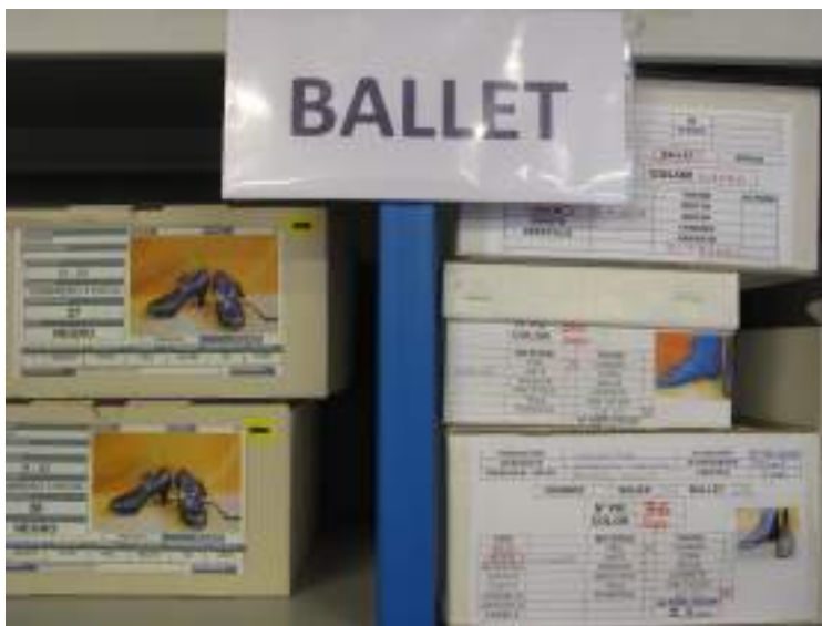
Clasificación de zapatos en el área de vestuario del teatro