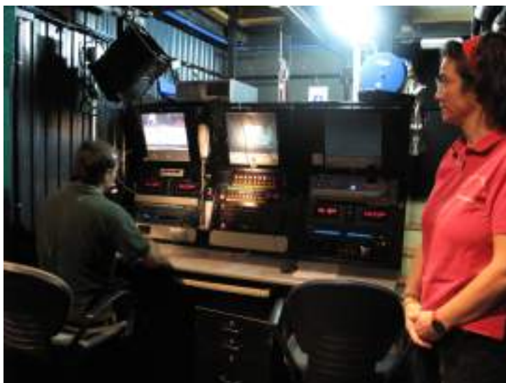
Lugar del Regidor