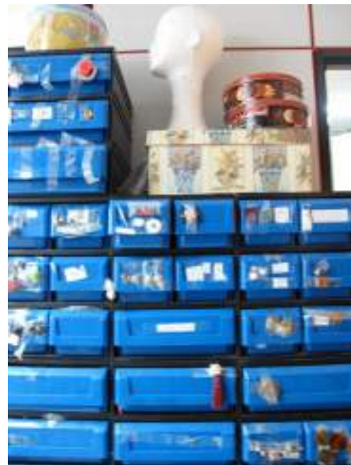
Aula de Vestuario