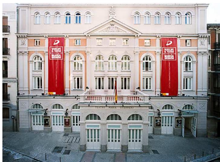
Fachada del Teatro María Guerrero (Centro Dramático Nacional – Madrid)

http://www.mcu.es/artesEscenicas/index.html .