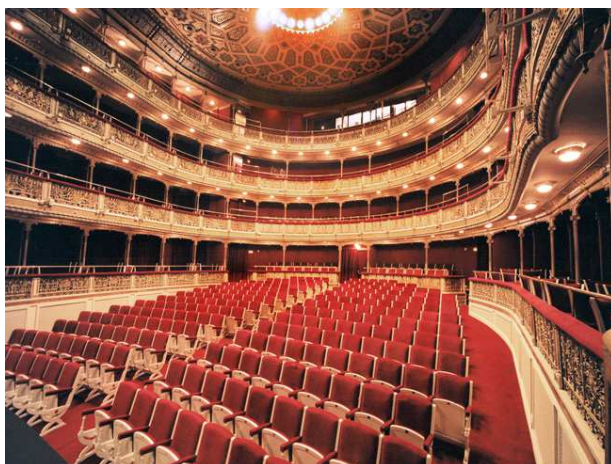
Cazuela del Teatro María Guerro (Centro Dramático Nacional – Madrid)

Es titular de cuatro grandes teatros nacionales (María Guerrero, Valle-Inclán, Teatro de la Comedia y Zarzuela), y de dos salas de dimensiones reducidas. Asimismo, integra dos compañías de danza (el Ballet Nacional y la Compañía Nacional de Danza) y una de teatro (la Compañía Nacional de Teatro Clásico).