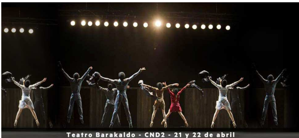
Teatro Barakaldo - CND2 - 21 y 22 de abril Actuación de la Compañía Nacional de Danza