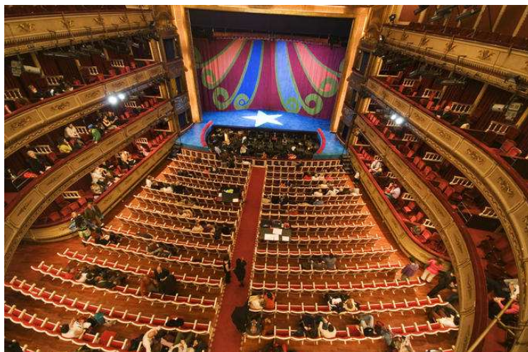
Teatro de la Zarzuela (Madrid): cazuela, foso y escenario

Los accesos a las páginas web de todas y cada una de las unidades del INAEM se encuentran en: