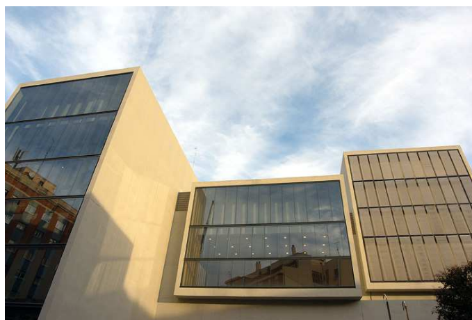
Fachada del Teatro Valle-Inclán (Centro Dramático Nacional – Madrid)

Gestiona, además, los Centros de Documentación de Teatro y de Música y Danza, el Museo Nacional del Teatro y el Auditorio Nacional de Madrid.