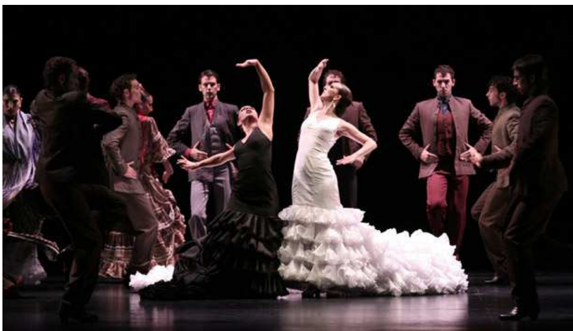
Actuación del Ballet Nacional de España

Además, y dada su función de distribuidor de las ayudas a la producción, exhibición y giras de espectáculos, es el principal ente público en el ámbito del fomento del espectáculo en vivo en España: